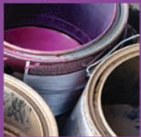
PINTURA Y SOLVENTES